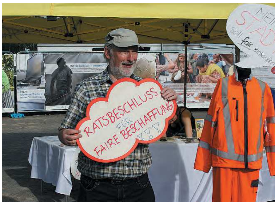
Am Stand konnten Bürger ihre Statements zur fairen Beschaffung auf ein Foto bannen.

Oft ist uns gar nicht bewusst, wie viele dieser Produkte wir direkt oder indirekt nutzen: Wir schlendern über Natursteine auf Marktplätzen, unsere Kinder spielen mit Spielzeug in der KiTa und wir profitieren von diversen Ämtern, die ohne Computer, Büroartikel und angemessene Berufsbekleidung nicht arbeiten könnten. Finanziert werden sie mit unseren Steuern. Um Kosten zu sparen, wird häufig