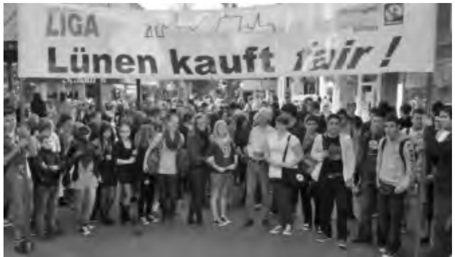
„Lünen kauft fair“: Über 300 Schüler aus Lünener Schulen formierten sich hinter dem Transparent und feierten mit einem Marsch durch das Einkaufszentrum den Titel Fairtrade-Stadt am 30. September.

Nach einem Abendgespräch über „Umwelt und gerechte Entwicklung“ mit FUGe-Vertretern am 15. Juli 2011 im Café Dreiklang möchten Eine-Welt-Akteure sowie Mitglieder des Agenda-Beirates aus Werl einen ähnlichen Weg zur Fairtrade-Stadt wie Lünen und Lippstadt gehen. Vergleichbare Entwicklungen zu Fairtrade-Städten in der Hellwegregion werden gerade vorbereitet durch Abend-