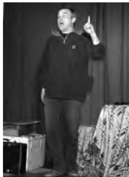
Ein-Mann-Teatherstück „Das Märchen vom Kürbiskind“

Arbeit von FUGe. Von der Eröffnung am 15. Mai bis zum Abschlussfeier am 11. September 2011 setzte sich die Ausstellung mit Fragen aus dem Alltag des Kontinents auseinander: Wie spielen, lernen und wohnen Kinder in Afrika?