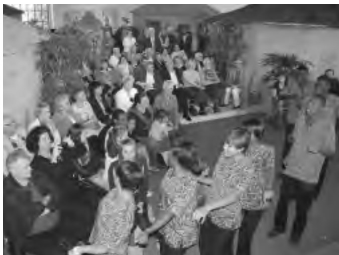
Schüler der Martin-Luther-Highschool aus Namibia, die bei der Geschwister-Scholl-Gesamtschule Lünen zu Besuch waren, eröffneten am 15. Mai die Afrika-Ausstellung im Maxipark