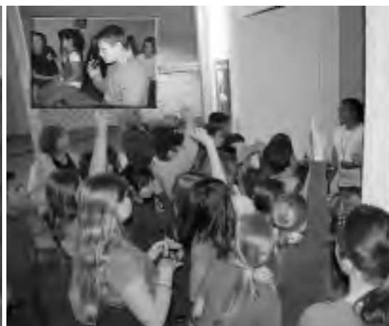
Erlebnisausstellung „Komm mit nach Afrika!“