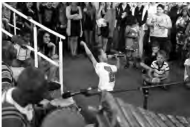
Eine-Welt-und-Umwelt-Tag „Kwa heri Afrika“

Gefördert wurden diese Veranstaltungen u.a. von der GIZ (Gesellschaft für Internationale Zusammenarbeit – Regionalzentrum NRW) und der Nordrhein-Westfälischen Stiftung für Umwelt und Entwicklung.