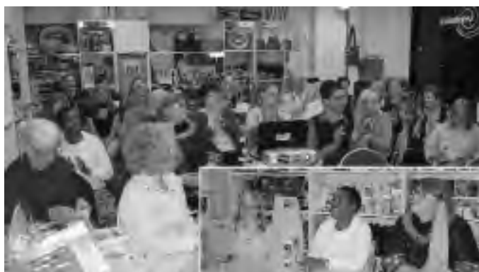
Gesprächsrunde „Tansanische Frauenpower“