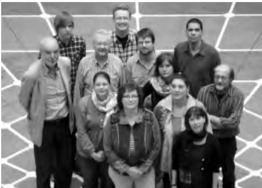
Vertreterinnen und Vertreter von Weltläden, Agenda-Büros, Eine-Welt-Zentren, wie FUG Hamm, sowie von kirchlichen Einrichtungen aus dem Ruhrgebiet haben sich seit 2008 zum „Netzwerk Faire Kulturhauptstadt Ruhr.2010“ zusammengeschlossen, um die erfolgreiche Unterzeichnung der Magna Charta Ruhr.2010 gegen ausbeuterische Kinderarbeit voranzutreiben. Heute nennen sie sich „Netzwerk Faire Metropole Ruhr“.

LiNet Lippstadt schreitet einen ähnlichen Weg zum Titel „Fairtrade Stadt“: Am 19. Juli 2011 fand auf Initiative des Lipp-