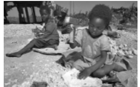
Ausschnitt aus dem Film Kindersklaven (WDR 2008)