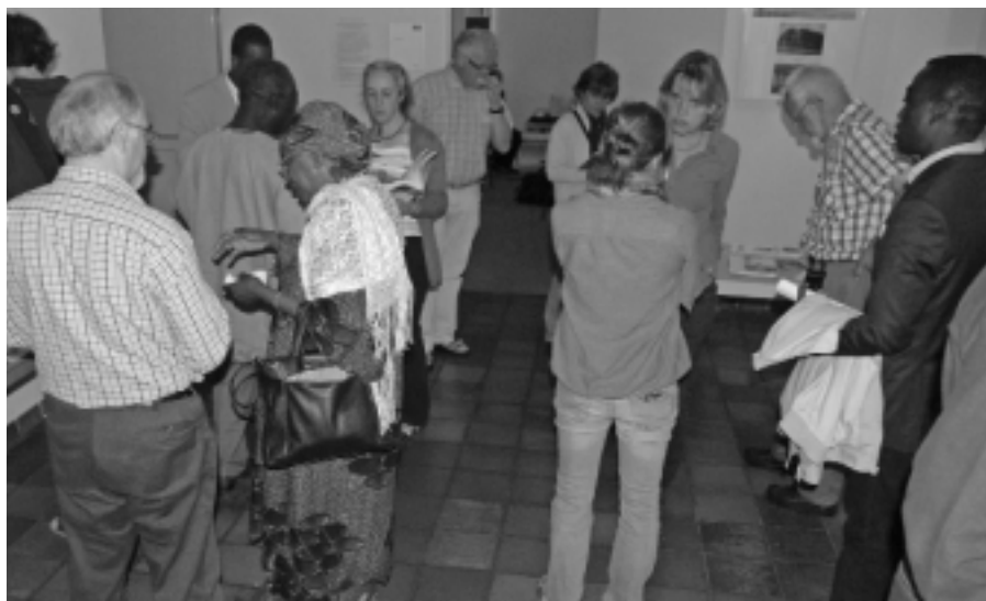
Erfahrungsaustausch unter den Teilnehmer/innen stand im Mittelpunkt des Afrika-Seminar der Hellwegregion in Hamm.

Ein weiterer Höhepunkt der Eine-Welt-Arbeit der Hellwegregion war das Afrika-Seminar Mai 2009 in der VHS Hamm. Es wurde von FUGe (Forum für Umwelt und gerechte Entwicklung) in Kooperation mit der VHS Hamm organisiert und förderte den Erfahrungsaustausch zwischen afrikanischen und nicht-afrikanischen Akteuren im Östlichen Ruhrgebiet und Kreis Soest in der entwicklungspolitischen Bildungsarbeit. In Vorträgen und Podien diskutierten deutsche und afrikanische Experten über den Klimawandel und behandelten die Rolle der Entwicklungszusammenarbeit in der Region.