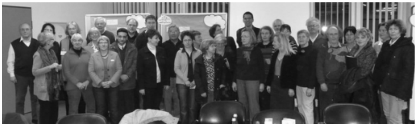
Teilnehmer des Netzwerktreffens der Eine-Welt- und Umweltgruppen aus Lippstadt am 19. März 2009

nen, Ausbreitung eines konsumkritischen Verhaltens unter der Bevölkerung und Stärkung des fairen Handels. Anlässlich der Unterzeichnung der Erklärung am 6. Juni 2009 wurde der WDR-Dokumentar-Film „Kindersklaven“ gezeigt, und zum Schluss fand eine Diskussion mit der Filmmacherin Rebecca Gudisch statt.