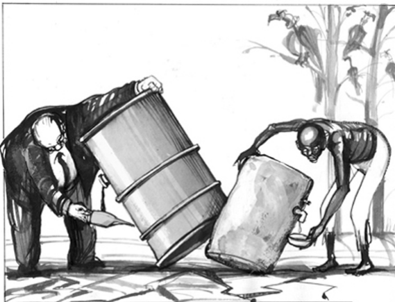
Resources in Africa von Wolfgang Ammer.jpg

Das Afrika-Seminar wird über InWent (Internationale Weiterbildung und Entwicklung gGmbH) aus Mitteln des BMZ und vom EED (Ev. Entwicklungsdienst) gefördert.